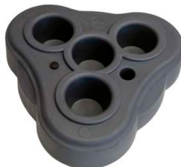
Porte boisson Flottant