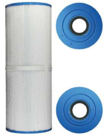
FILTRE IDOL SPAS

Cartouche filtrante à changer tous les 6 mois.