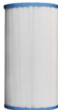
FILTRE ALPS SPAS SERIE POLY SPA

Cartouche filtrante, à changer tous les 6 mois.