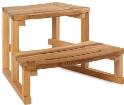
Escalier arrondi Red Cedar H 480 x L 800 x P 710 mm