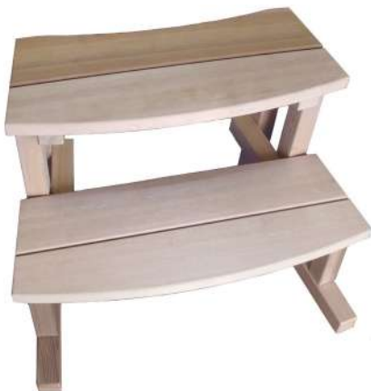
Petite marche Red Cedar H 480 x L 660 x P 410 mm