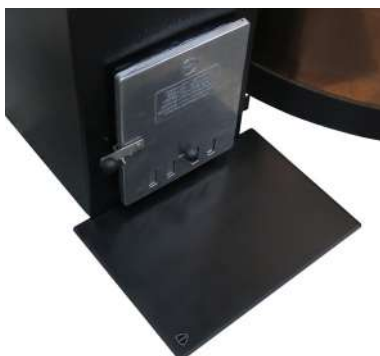
Plaque de sol coupe feu 42 x 55 x 1 cm