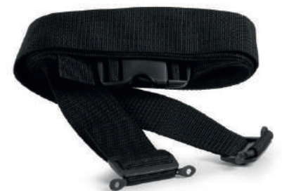
SANGLE SECURITE COUVERTURE

De 2,20 à 2,40 m, housse polyester protégée des intempéries, saletés et autres débris - cordon de serrage pour le vent, fourni avec son sac de rangement.