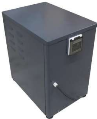
Poêle électrique avec système de filtration + connectique