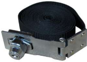
Verrou de sécurité pour couvertures