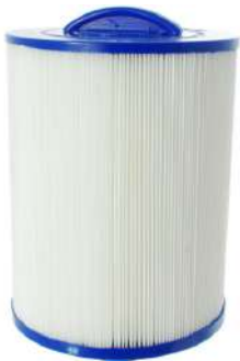
FILTRE ALPS SPAS VIKING SPAS