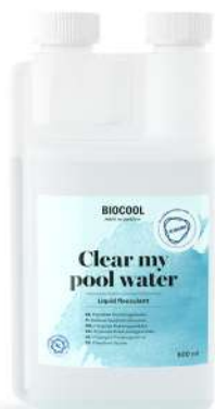
Floculant 0,50 L