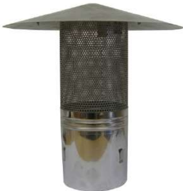
Chapeau avec grille pare étincelles 120 mm