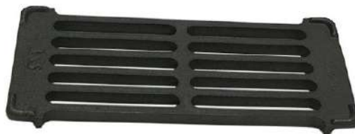
Grille de poêle 13,5 x 29 cm