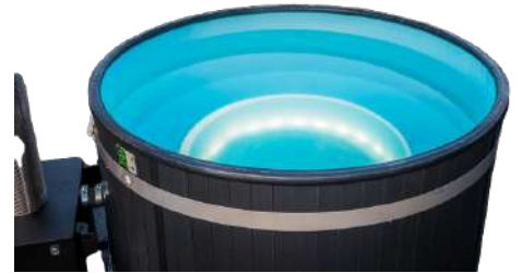
Led cuve LDPE