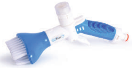
BROSSE FILTRE CYCLONE

Aspirateur succion spa - brosse spa - épuisette spa.