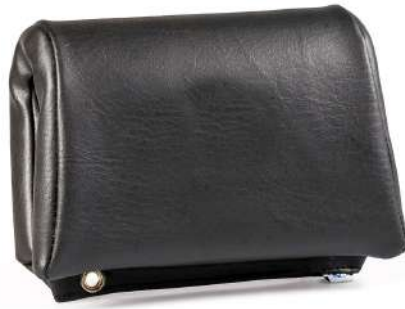
Appui tête noir ou marron - H 24 cm