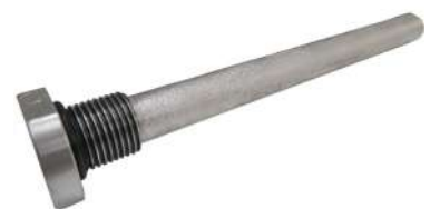
Tige d'anode de magnésium à changer tous les ans