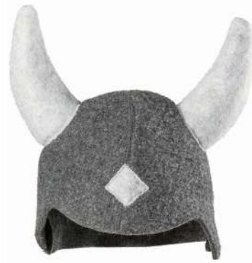
Chapeau Viking de bain gris ou rose