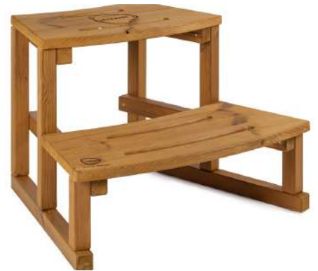
Escalier arrondi Thermowood H 480 x L 800 x P 710 mm