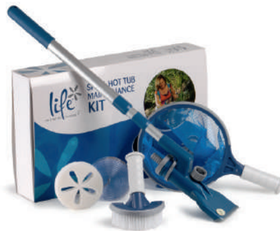
KIT MAINTENANCE SPA

Super moelleux, en mousse alveolée et finition vinyle, lesté à l'arrière, il s'adapte à tous les spas - de couleur noir, blanc ou gris.