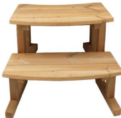
Petite marche Thermowood H 480 x L 660 x P 410 mm