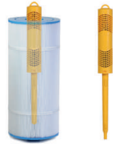
CARTOUCHE NATURE 2

Adaptable grâce à ses bras réglables, résistant aux intempéries - de couleur gris ou beige.