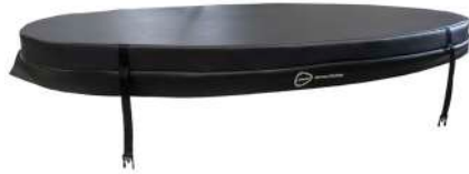
Couverture Isolante Diamètre 200 cm