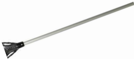
Pagaie de mélange