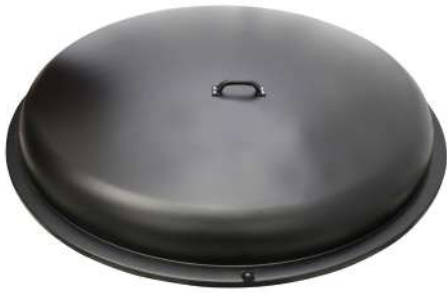
Couverture ABS Diamètre 170 cm