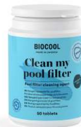
Nettoyant filtre Bio 50 pièces