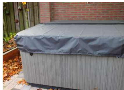
HOUSSE DE PROTECTION COUVERTURE

Aucune fixation, glisse sous le spa, pivote à 180° pour entrer et sortir, verrouillage pour plus de sécurité, éclairage LED à l'extrémité de la rampe.