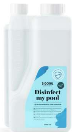
Désinfectant eau 1 L