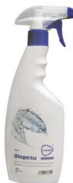
Nettoyant spay Bio 0,5 L