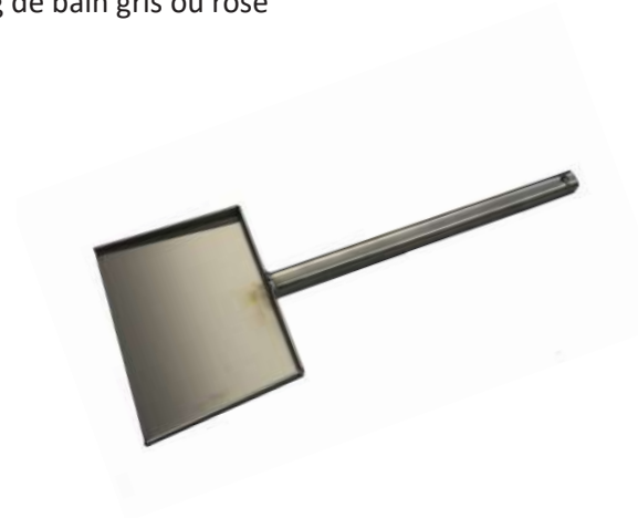
Pelle à cendre 57 x 24 cm