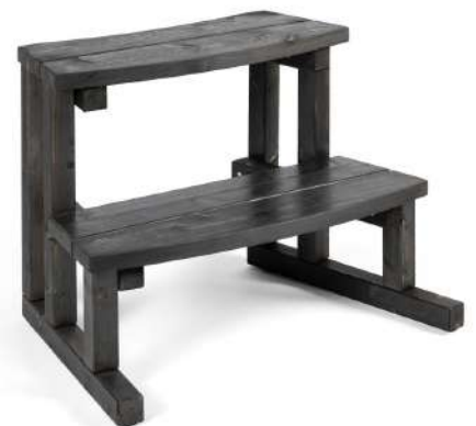
Petite marche Pin findandais - Noir charbon H 480 x L 660 x P 410 mm